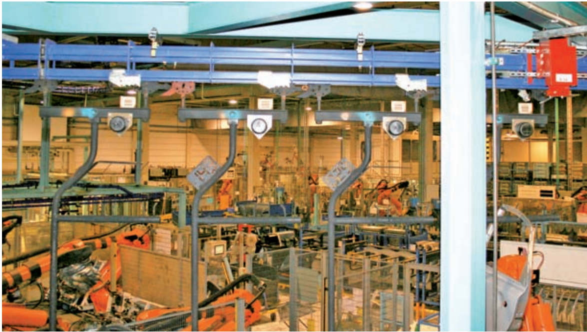
Bis heute werden in der Regel die Transportsysteme per RFID-Datenträger identifiziert, wie hier die Gehänge beim Zulieferer Tower Automotive

Vorbeifahren auslesen lassen. Um auch UHF-Systeme im Stehen lesen zu können, hat Turck Schreibleseköpfe mit zwei Antennen im Programm, die ihre Polarisationsrichtung verändern und so ein bewegtes Feld simulieren. Bei Volvo in Gent arbeitet man mit dieser UHF-Technologie seit ihrer Einführung ohne Störungen.