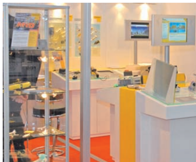
Auf Messen informiert Turck über die Machbarkeit einer

Diese Lösung findet sich im UHF-Frequenzbereich von 865-868 MHz, der Reichweiten bis zu drei Meter erlaubt. Leider hat auch diese Medaille zwei Seiten, denn die hohen Reichweiten muss sich der Anwender mit einer deutlich aufwändigeren Installation erkaufen. So kann es teilweise durch Reflexionen zu Überreichweiten der Signale kommen, so dass die Schreibleseköpfe mehr sehen als sie sehen sollen. Darüber hinaus gibt es meist Probleme, wenn ein UHF-Tag im Stehen ausgelesen werden muss, weil Interferenzen zu Nullstellen im Übertragungsfeld führen können – eine Herausforderung, denn in Prozessen, in denen RFID die zuvor genutzten Barcodes ersetzt, gibt es an den Lesestellen prozessbedingt meist einen Stillstand, weil sich Barcodes nicht im