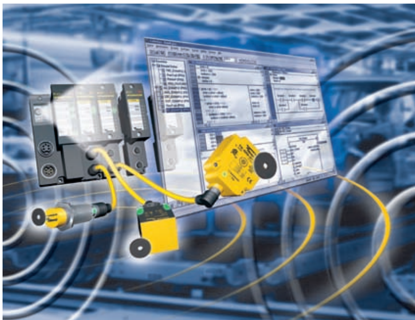
An Turcks modularem RFID-System BL ident lassen sich störsichere HF- und reichweitenstarke UHF-Schreibleseköpfe parallel betreiben

Der Siegeszug von RFID in der Automobilproduktion begann vor rund 20 Jahren. Seit fünf Jahren ist auch Turck mit seinem modularen RFID-System BL ident dabei, das seinerzeit in enger Zusammenarbeit mit Automobilherstellern entwickelt wurde. So war bereits einer der ersten BL ident-Datenträger ein Hochtemperatur-Tag, der problemlos 210 °C standhalten konnte. Dieser Tag lässt sich an einem Schlitten – dem so genannten Skid – montieren, auf dem eine Karosserie durch die Produktion transportiert wird. Auf diesem Weg kann der Weg des Fahrzeugs vom Rohbau bis zur Endmontage verfolgt werden, solange das Transportsystem nicht gewechselt wird.