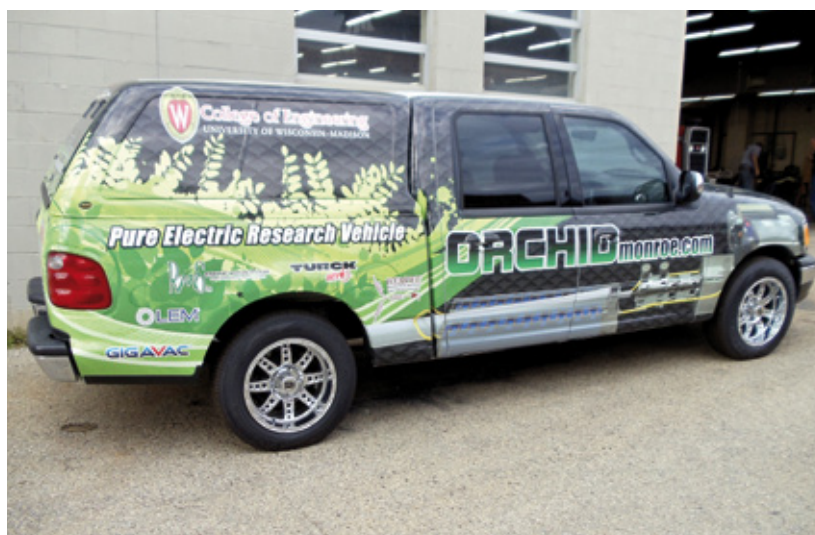
Forschungsfahrzeug: Phillip Kollmeyer hat mit Unterstützung von Orchid und Turck einen Ford-Pickup-Truck F-150 als Elektromobil umgebaut

Kollmeyer hat davon enorm profitiert: „Viele Verbindungen in unserem Forschungsfahrzeug sind empfind-