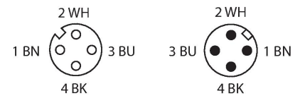
diagrama de conexiones