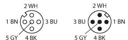
diagrama de conexiones