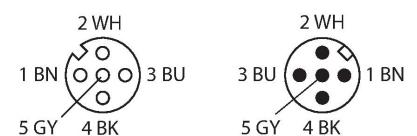
diagrama de conexiones