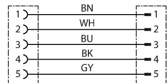
diagrama de conexiones