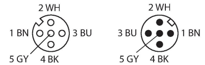
schéma de connexions