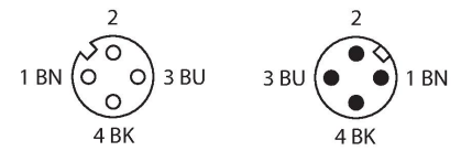
schéma de connexions