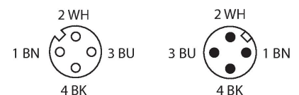
schéma de connexions