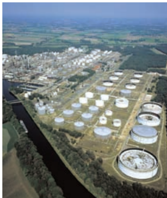
Die BP Lingen, Erdölraffinerie Emsland, produziert vor allem Ottokraftstoffe, Dieselkraftstoffe, Jet Fuel, leichtes Heizöl und Chemievorprodukte