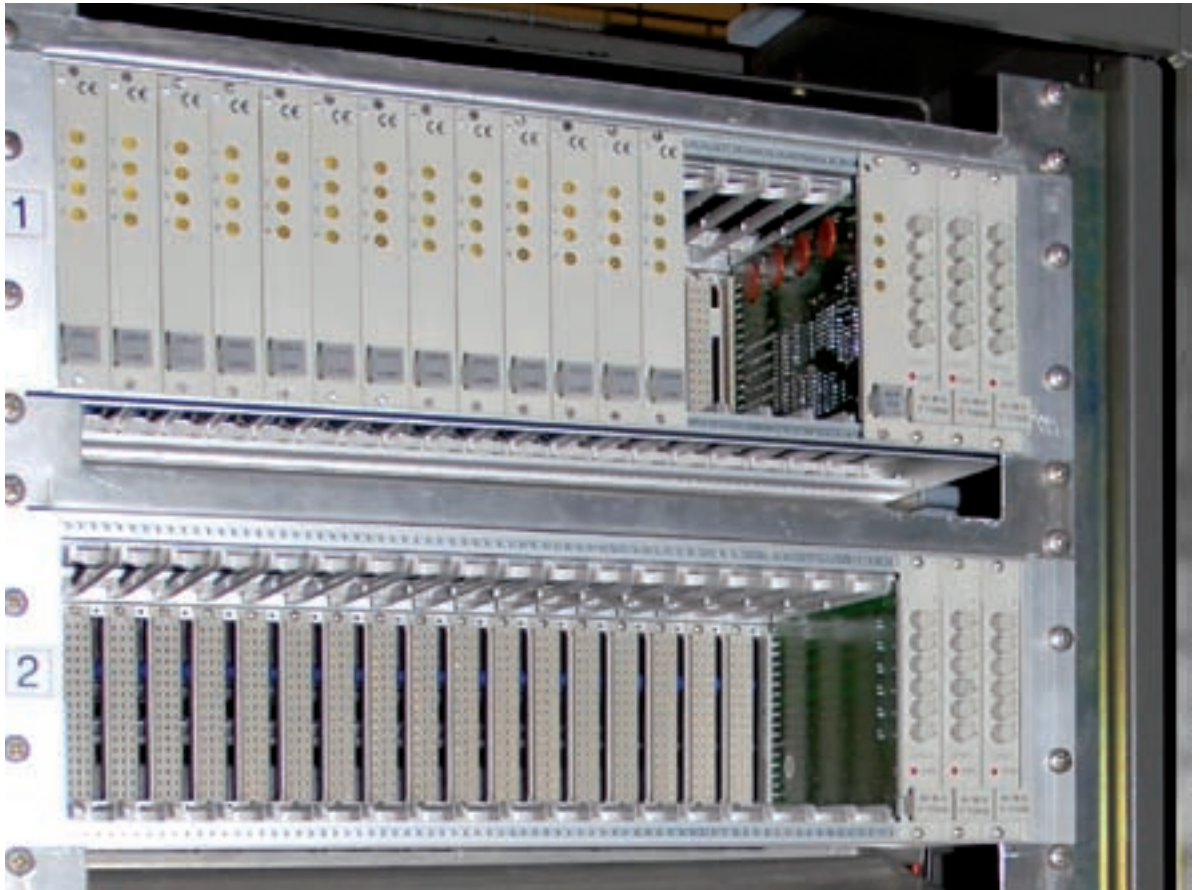
Raumgewinn: BP Lingen ersetzt immer mehr alte 19-Zoll-Messum- former durch Hutschienen- geräte von Turck