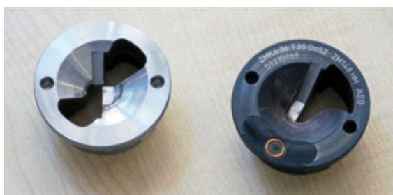
Der kompakte Datenträger konnte gut geschützt im Fräskopf (rechts) eingelassen werden