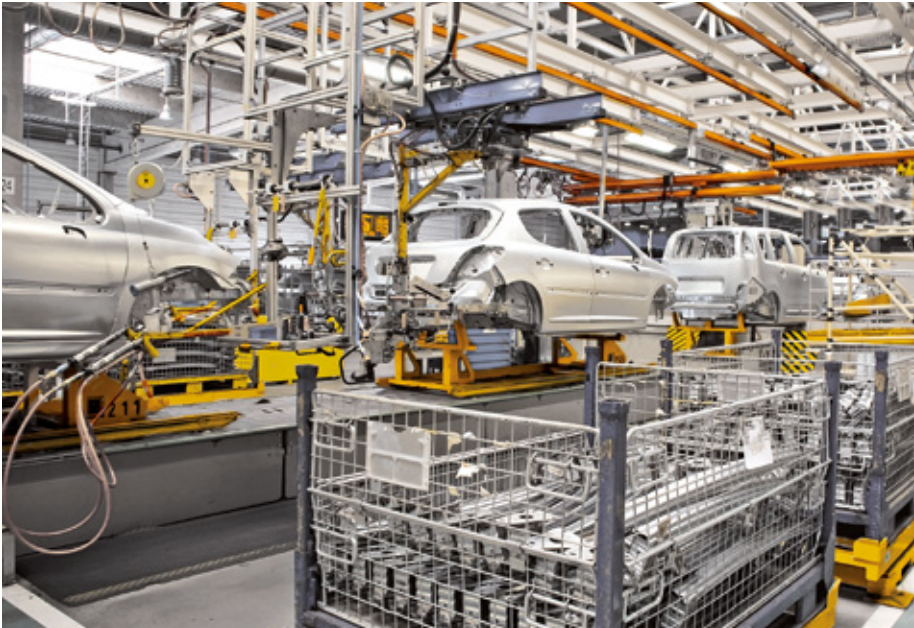
Leselöcher durch Reflektion an metallischen Objekten vermeidet die umschaltbare Polarisation